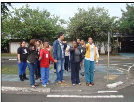
Programa de Educação de Trânsito para Pessoas com Deficiência

Essa atividade, realizada no Espaço Vivencial de Trânsito, tem por objetivo incluir a pessoa com deficiência nos diferentes segmentos sociais: trabalho, escola e circulação independente; reduzir o número de acidentes e atropelamentos envolvendo o público-alvo; desenvolver o senso de perigo no trânsito; realizar tarefas que estabeleçam padrões de segurança na mobilidade urbana.