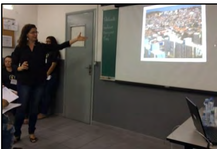
Palestra Mobilidade Urbana – Caminhos para reinventar a cidade

A palestra, realizada em empresas, traz uma reflexão sobre o esgotamento do modelo de mobilidade que privilegia o uso do carro particular, e um debate sobre os possíveis caminhos para a reinvenção da cidade, com uma mobilidade voltada para a qualidade de vida da coletividade.