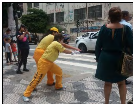
Mímica - Volta às aulas