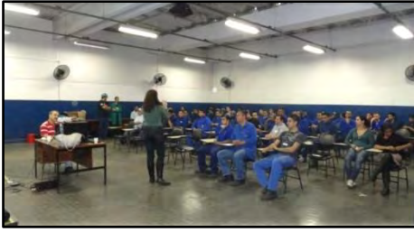
Palestra - Sustentabilidade e Mobilidade Urbana