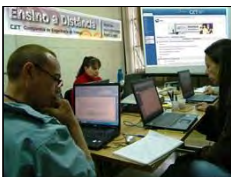
Cursos na Modalidade a Distância

A Educação à Distância no Brasil foi normatizada pela Lei de Diretrizes e Bases da Educação Nacional – LDBEN nº 9394 em 20 de dezembro de 1996, atendendo ao público que devido à correria do dia a dia não tem tempo de frequentar aulas presenciais ou de se encaminhar às instituições promotoras dos cursos. A Educação à Distância, modalidade de educação que ocupa um papel cada vez mais importante no desenvolvimento social do país, torna-se um ambiente propício para ampliar o trabalho de educação de trânsito e capacitar docentes para serem agentes multiplicadores nas escolas e na comunidade.