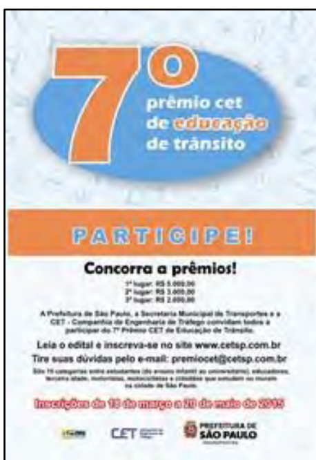
Prêmio CET de Educação de Trânsito

Concurso público anual que tem por objetivo incentivar a reflexão, a criatividade e a produção de trabalhos voltados para a segurança no trânsito. O Prêmio CET atinge a população do município de São Paulo, a partir dos 3 anos de idade, idosos, condutores em geral, incluindo ciclistas e motociclistas, entre outros. Assim, as categorias que compõem o prêmio procuram atingir todo cidadão usuário do sistema – trânsito, passageiro, pedestre, condutor e agente de trânsito. No Ano de 2015 – aconteceu a 7ª Edição - como tema central “Juntos por um trânsito mais saudável”.