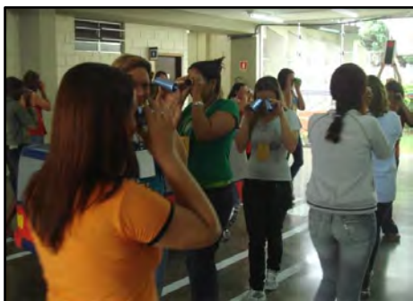
Capacitação de professores: Mobilidade Urbana - Formando Novos Valores

Abordam questões conceituais referentes à mobilidade urbana, ao espaço público, trabalho em equipe, mobilidade e compartilhamento do espaço viário, os papéis que exercemos no espaço público e reflexões sobre ações importantes para transformação da realidade do trânsito; mobilidade urbana como tema transversal, influencia das mídias no comportamento humano, acessibilidade e reflexões sobre soluções para a circulação urbana.