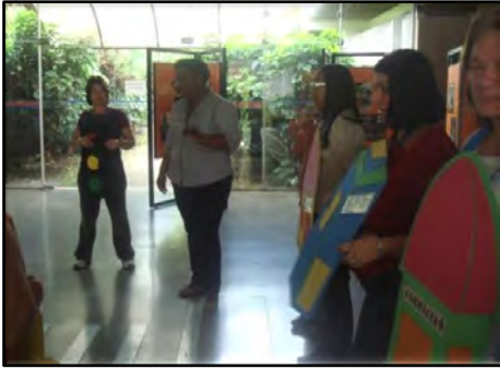
Capacitação de professores: Construindo um novo olhar sobre a mobilidade urbana