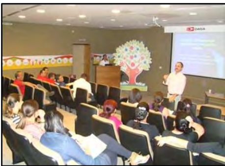
Palestra - Acessibilidade e Mobilidade Urbana

O objetivo desta palestra, realizada em empresas, é proporcionar ao universo de pessoas sem deficiência elementos que estabeleçam uma maior compreensão e diálogo sobre o mundo de pessoas com deficiência e mobilidade reduzida, além do entendimento sobre o Desenho Universal.