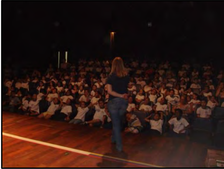
Semana da Mobilidade 2015 - Seja você a mudança na cidade

de Educação. Foram oferecidas as atividades: Teatro de Fantoches - A História de Bob – Educação Infantil; Pintando na Escola – Ensino Fundamental I; Gincana Educativa de Trânsito – Ensino Fundamental II, Mímica – Pedestres; Reunião com os professores: A importância de trabalhar o tema mobilidade com seus alunos – Corpo docente.