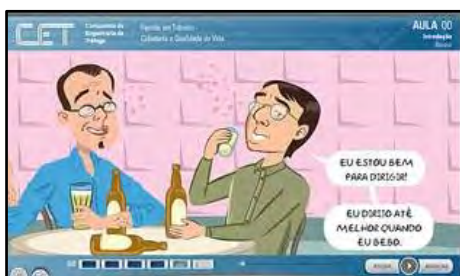
Família Em Trânsito - Cidadania e Qualidade de Vida

O curso tem por objetivo despertar valores como tolerância, educação, solidariedade, respeito e cordialidade para promover ações seguras no trânsito. Público alvo: pessoas acima de 16 anos interessados no tema. Carga horária: 08 horas. Temas: Segurança no trânsito como responsabilidade de todos; Atitudes como tolerância, educação e cordialidade, no compartilhamento do espaço público; Qualidade de vida relacionada a comportamento consciente no trânsito; Contexto Mobilidade urbana sustentável e o transporte alternativo.