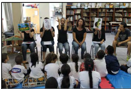
Atividade para pessoas com deficiência auditiva