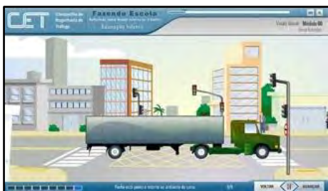
Ações Seguras no Trânsito

características psicológicas e físicas da criança de 0 a 10 anos, considerando a interferência destes fatores na segurança no trânsito.