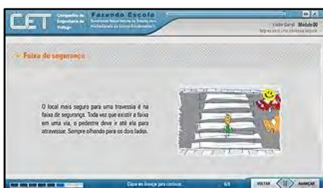
Segurança e Mobilidade

O Curso de Capacitação de Professores para o Ensino Fundamental I visa fornecer ao educador subsídios para que possa inserir o tema trânsito no currículo escolar. Público alvo: Professores da rede de ensino pública e privada; Estudantes de Licenciatura em pedagogia ou psicologia; Interessados pelo tema. Carga horária: 20 horas/aula cada. Temas: Reflexão sobre a importância de abordar o tema trânsito como exercício de cidadania e a importância da educação para o trânsito com este fim; Apresentação das características psicológicas e físicas da criança de 6 a 15 anos, considerando a interferência destes fatores na segurança no trânsito; Desenvolvimento de projetos que tenham como tema o trânsito, em toda a rede escolar de ensino da cidade de São Paulo.