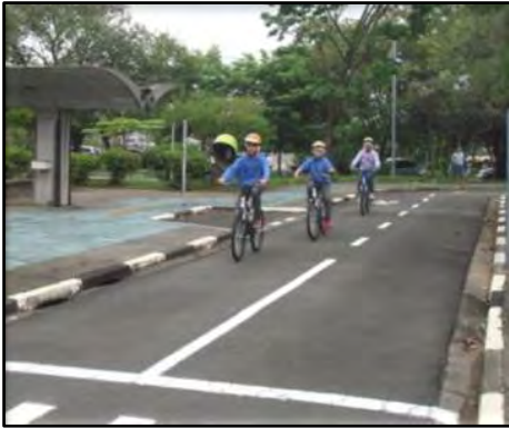
Desafios do Trânsito

adolescentes buscam soluções para os desafios propostos tendo em vista as regras de segurança. Público alvo: alunos do Ensino Fundamental II. Duração: 2h30.