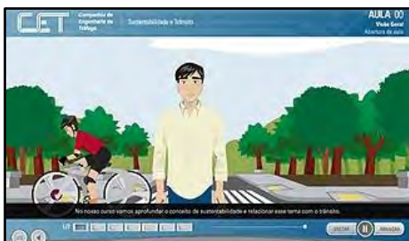
Sustentabilidade e Trânsito

O curso Sustentabilidade e Trânsito possibilita uma reflexão sobre o trânsito e o meio ambiente, e com a tomada de consciência dessa relação, a adoção de novos comportamentos e atitudes no cotidiano das grandes metrópoles. Público alvo: Professores da rede de ensino pública e privada; Estudantes de Licenciatura em pedagogia ou psicologia; Interessados pelo tema. Carga horária: 20 horas/aula cada. Temas: Mitologia Grega - Teoria de Gaia; Movimentos ambientalistas; Conceito de sustentabilidade; Panorama histórico; Conceito de cidadania, de espaço público e ética. Relação desses conceitos com a utilização responsável do espaço público.