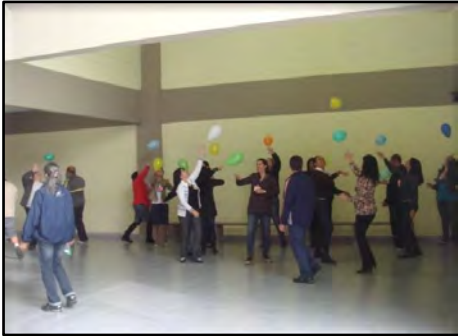
Capacitação de professores: Mobilidade Urbana – Incorporando novos Comportamentos