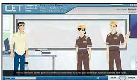
Mobilidade Urbana – Tema de Sala de Aula

em suas diferentes abordagens e quais os comportamentos adequados para que as pessoas transitem com mais segurança; Apresentação de técnicas para uso pelo professor em sua prática de sala de aula.