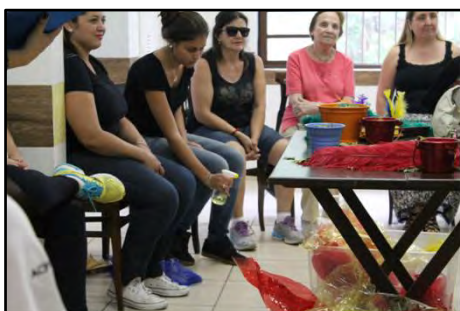
As descobertas de Tiê

Esta contação de história fez parte de uma série de atividades inclusivas que foram realizadas em comemoração ao dia da pessoa com deficiência.