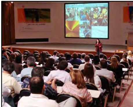
Palestra Segurança no Trânsito e Qualidade de Vida

Palestra ministrada em empresas ou instituições, com o objetivo de promover a reflexão sobre a importância da adoção de atitudes seguras e solidárias, visando a melhoria das condições de circulação no trânsito e da qualidade de vida de condutores e pedestres. O público alvo desta atividade é formado pelos diversos usuários do sistema viário, tais como: motoristas, motociclistas, ciclistas e pedestres, fatores de segurança no trânsito. Carga horária: 1 hora.