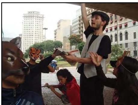
Teatro de Adulto – Entre Pedestres e Lobos

Atividade realizada em empresas, instituições ou locais públicos, por meio da qual os espectadores são convidados à reflexão de temas associados à adoção de atitudes cidadãs, no contexto das grandes cidades, da responsabilidade individual como elemento catalisador, promotor da transformação das relações humanas para a convivência harmoniosa no trânsito. Duração: 30 minutos.