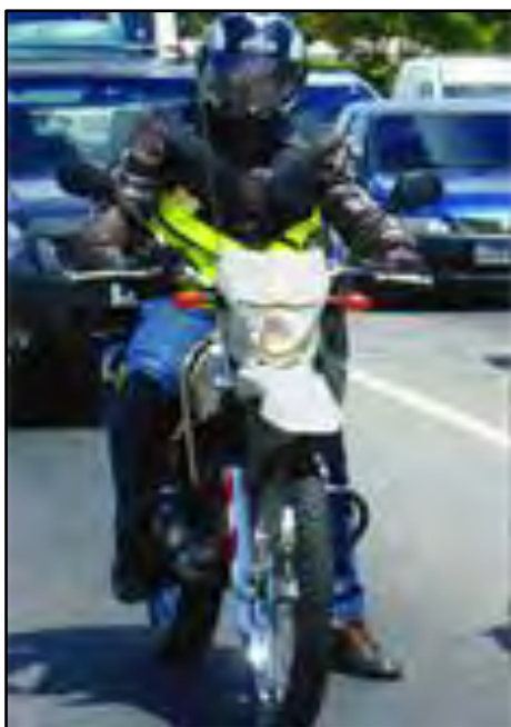
Curso para Profissionais de Motofrete

Curso Obrigatório, de acordo com a Lei Federal 12.009 e Resolução CONTRAN 410 de 02/08/2012, para o motociclista profissional que realiza transporte de pequenas mercadorias. O curso aborda todo o conteúdo necessário para a boa prática da profissão de motofrete, tanto no aspecto da legislação que regulamenta o setor, quanto nos conhecimentos de trânsito e de como pilotar a motocicleta com segurança e cidadania. Carga Horária: 30 horas/aula, sendo que, 5 horas/aula são de prática em pista de treinamento para motociclistas.