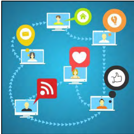
Educomunicação e Trânsito