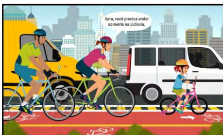
Pedalar com Segurança

Com objetivo orientar sobre os aspectos de segurança e técnica ao pedalar, bem como promover a conscientização sobre a importância do compartilhamento do espaço público com respeito aos outros usuários. Público alvo: Destina-se aos ciclistas a partir dos 16 anos que utilizam a bicicleta nas vias públicas e nas áreas de lazer, Interessados pelo tema. Carga horária: Carga horária de 4 horas distribuídas em quatro aulas para serem cursadas no prazo de dez dias. Temas: A História da Bicicleta; O ciclista e o trânsito; Segurança durante o trajeto; Dicas de saúde.