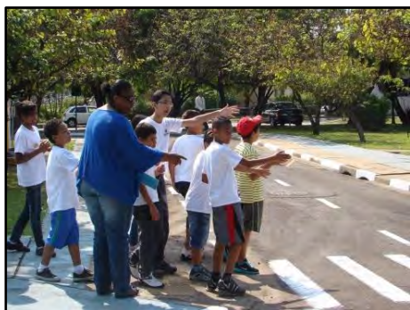
Caça ao Tesouro

Atividade realizada no Espaço Vivencial de Trânsito Caio Graco, onde os alunos percorrem o circuito desvendando as pistas e respeitando as leis de segurança no trânsito, até chegarem ao tesouro. A atividade possibilita às crianças a vivência de várias situações de trânsito e a reflexão sobre o comportamento mais seguro. Público alvo: alunos do Ensino Fundamental I, do 1º ao 5º ano. Duração: 2h30.