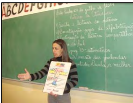
Pintando na Escola

no trânsito e a importância do seu papel para o meio ambiente e para a cidadania. Após a apresentação, os alunos receberam material didático com o objetivo de reforçar os conteúdos abordados.