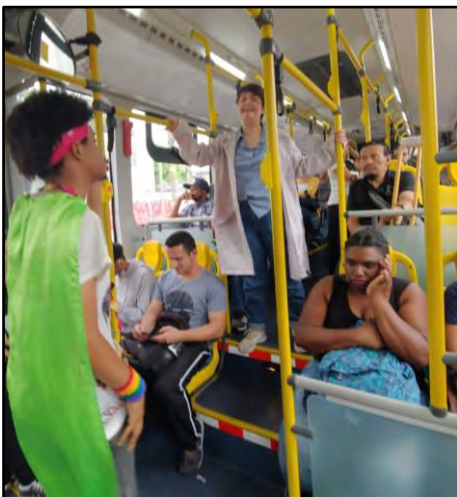
Esquete Teatral - Dr Stress e Super De Boa

O esquete interativo tem por objetivo promover a reflexão sobre a incidência de atropelamentos em corredores/faixas exclusivas de ônibus. A peça conta a história de um homem apressado e estressado que deseja reunir uma legião de estressados que tem atitudes erradas no trânsito e juntos, dominar o mundo. Surge a "Super De Boa" heroína que vem para salvar o mundo através da calma e da educação. A atividade é realizada em terminais de ônibus e no interior do transporte Coletivo, sendo dirigida aos seus usuários. Duração: 5 minutos.