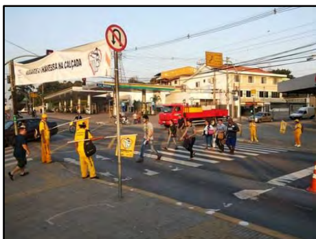
Travessia Segura – Orientadores de Travessia

O objetivo é incentivar o respeito à sinalização de trânsito e às regras do Código de Trânsito Brasileiro, orientando os pedestres a atravessar em locais seguros e sinalizados, de acordo com os estágios dos semáforos destinados a eles, e instruindo os motoristas a obedecer às faixas de travessia. A ação dos Orientadores de Travessia é preventiva, aumentando o nível de atenção de motoristas e pedestres. Os orientadores de travessia são selecionados, contratados e capacitados. Os orientadores atuam uniformizados e portam estandartes com mensagens educativas de trânsito como “Pedestre, aguarde na calçada”, ou “Cuidado com a conversão de veículos”, entre outras.