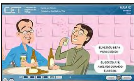
Família Em Trânsito - Cidadania e Qualidade de Vida

O curso tem por objetivo despertar valores como tolerância, educação, solidariedade, respeito e cordialidade para promover ações seguras no trânsito. Público alvo: pessoas acima de 16 anos interessados no tema. Carga horária: 08 horas. Temas: Segurança no trânsito como responsabilidade de todos; Atitudes como tolerância, educação e cordialidade, no compartilhamento do espaço público; Qualidade de vida relacionada a comportamento consciente no trânsito; Contexto Mobilidade urbana sustentável e o transporte alternativo.