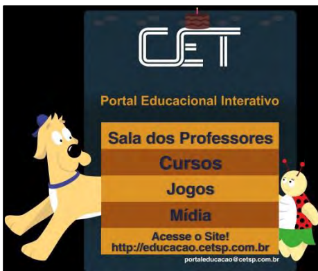
Portal Interativo Educacional

É um importante canal de divulgação de conteúdo e práticas seguras de trânsito e contribui para sustentar campanhas educativas pela internet dos projetos implantados pela CET, contribuindo assim, para a construção de um modelo sustentável para a cidade de São Paulo. O Portal busca incentivar a reflexão e a criatividade, mostrando que a educação e a segurança no trânsito podem ser transmitidas de maneira leve e descontraídas, através de jogos, atividades lúdicas, download, vídeos, músicas e conteúdos relacionados à cidadania no trânsito. http://educacao.cetsp.com.br/