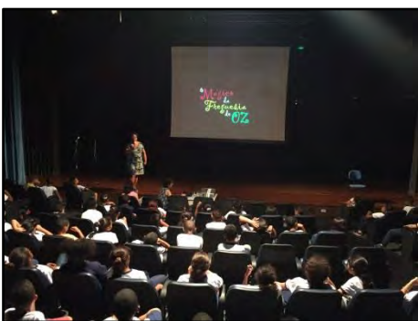
CineTrânsito – O Mágico da Freguesia de Oz

O filme O Mágico da Freguesia do OZ foi inspirado na história de O Mágico de Óz, adaptada para a realidade de São Paulo. Conta as aventuras de Dorotéia, uma menina que sai do interior, buscando sua identidade na cidade grande. Nesta jornada enfrenta desafios e situações que a fazem ultrapassar obstáculos, enfrentar medos e fazer descobertas junto com seus amigos até chegar à Freguesia de Óz. Os conceitos de segurança do pedestre, cidadania e sustentabilidade são trabalhados no decorrer da história.