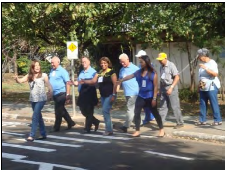
Programa de Educação de Trânsito para Terceira Idade

Atividade destinada aos participantes de grupos organizados de terceira idade, realizada no CETET, onde ocorre a vivência e diálogo a respeito de comportamentos seguros para uma melhor convivência com os problemas do trânsito. Nesta atividade, cria-se a oportunidade de reflexão sobre a interferência de limitações físicas, decorrentes da idade, em sua segurança enquanto pedestres. Os objetivos são incitar a vivência e o diálogo a respeito de comportamentos seguros para uma melhor convivência com os problemas do trânsito; refletir sobre a interferência de limitações físicas, decorrentes da idade, em sua segurança enquanto pedestres.