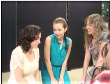
Teatro para Ensino Médio - Inconsequente Baby

Atividade realizada nas Escolas de Ensino Médio, que utiliza a linguagem do teatro para fazer os alunos refletirem sobre a importância da segurança no trânsito, os comportamentos adequados e éticos e mobilidade sustentável. Aborda assuntos tais como álcool e direção, habilitação, travessia, condução de motocicletas, entre outros.