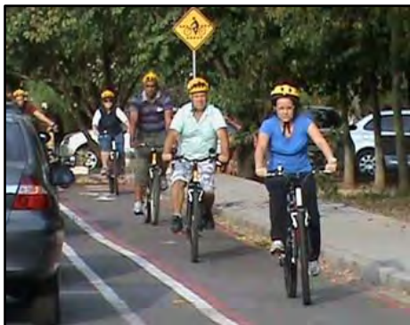
Curso Pedalar com Segurança

alongamento. Público alvo: maiores de 16 anos que saibam andar de bicicleta. Carga horária: Módulo teórico – 4 horas e Módulo Prático – 4 horas.