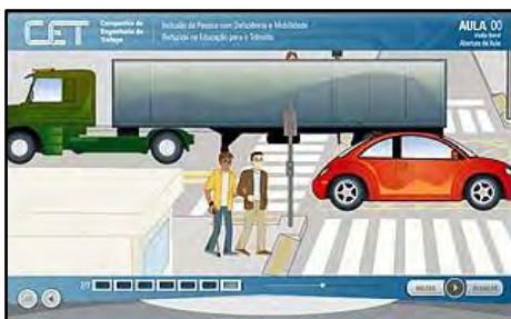
Inclusão da Pessoa com Deficiência e Mobilidade Reduzida na Educação para o Trânsito.

integração e o processo de inclusão da pessoa com deficiência no Ensino Infantil e Fundamental; A circulação urbana da pessoa com deficiência.