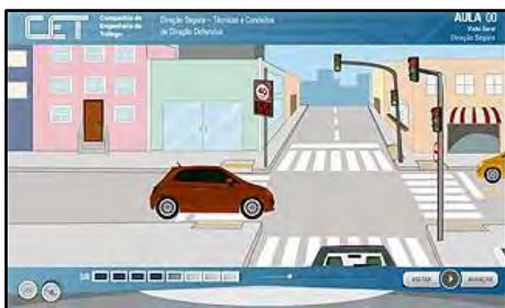
Direção Segura - Técnicas e Conceitos de Direção Defensiva

Como evitar acidentes, dispositivos de segurança e procedimentos em caso de acidentes de trânsito.