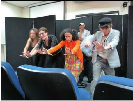
Teatro de Adulto – A Árvore do Trânsito

Atividade realizada em empresas, instituições ou locais públicos, cuja proposta é abordar a questão da solidariedade nas relações interpessoais no trânsito. Entretanto, as temáticas são ampliadas na diversidade das dinâmicas e motivações individuais de cada um de seus protagonistas, dos históricos pessoais ocorridos, anterior ao encontro dos mesmos num engarrafamento no trânsito. Duração: 30 minutos