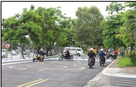
Curso Pilotagem Segura para Motociclistas

Desenvolver valores de segurança e cidadania e promover o aprimoramento de técnicas de pilotagem de motocicletas são os principais objetivos deste curso que compreende módulo teórico e prático. Na primeira etapa são abordados conceitos de legislação de trânsito, manutenção preventiva da moto, prevenção de acidentes, primeiros socorros e, principalmente, o comprometimento do motociclista com a sua segurança e dos demais usuários da via. O módulo prático é realizado em pista de treinamento com motocicletas da CET. Os exercícios propiciam a correção de vícios e posturas que interferem negativamente na pilotagem. Público alvo: Empresas que buscam o aperfeiçoamento de seus empregados usuários de motocicletas e também motociclistas que, individualmente, almejam seu aprimoramento. Carga horária: Módulo teórico: 8 horas divididas em dois períodos de quatro horas e Módulo prático: 8 horas.