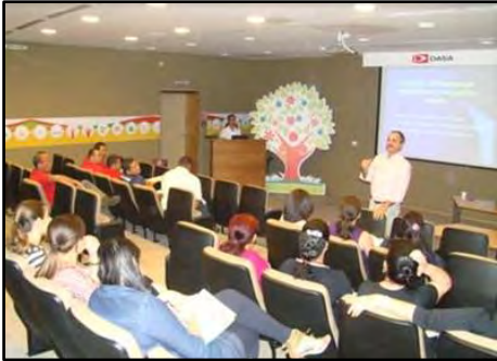
Palestra - Acessibilidade e Mobilidade Urbana