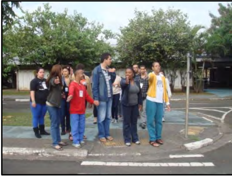
Programa de Educação de Trânsito para Pessoas com Deficiência