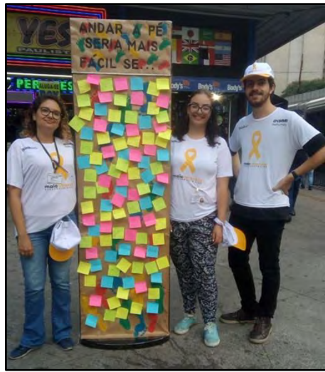
Painel de opinião e percepção