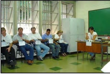
Curso de Formação para Motorista de Táxi