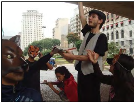
Teatro de Adulto – Entre Pedestres e Lobos

Atividade realizada em empresas, instituições ou locais públicos, por meio da qual os espectadores são convidados à reflexão de temas associados à adoção de atitudes cidadãs, no contexto das grandes cidades, da responsabilidade individual como elemento catalisador, promotor da transformação das relações humanas para a convivência harmoniosa no trânsito. Duração: 30 minutos.