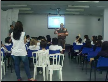
Agente de Trânsito na Escola

A atividade Bate Papo sobre o Trânsito, realizada por agentes de trânsito e educadores, consiste em uma apresentação lúdica interativa que oferece ao operador, como agente multiplicador, a oportunidade de executar a sua função de orientador e educador, junto à comunidade escolar. Público alvo: alunos do último ano do Ensino Fundamental I. Duração: 50 minutos.