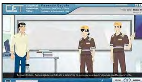
Mobilidade Urbana – Tema de Sala de Aula

pessoas transitem com mais segurança; Apresentação de técnicas para uso pelo professor em sua prática de sala de aula.