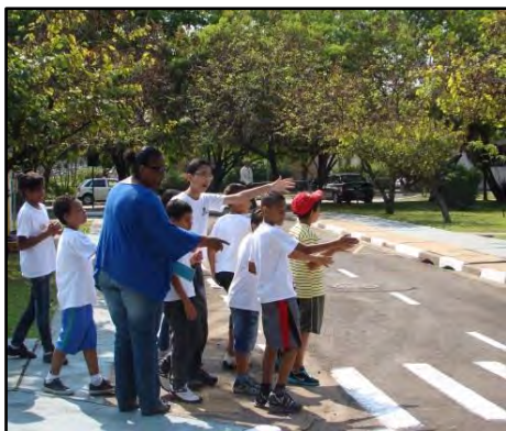
Caça ao Tesouro

Atividade realizada no Espaço Vivencial de Trânsito Caio Graco, onde os alunos percorrem o circuito desvendando as pistas e respeitando as leis de segurança no trânsito, até chegarem ao tesouro. A atividade possibilita às crianças a vivência de várias situações de trânsito e a reflexão sobre o comportamento mais seguro. Público alvo: alunos do Ensino Fundamental I, do 1º ao 5º ano. Duração: 2 h30.