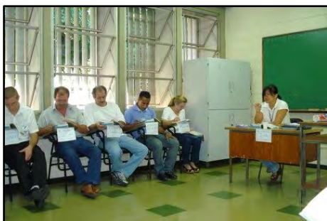
Curso de Formação para Motorista de Táxi