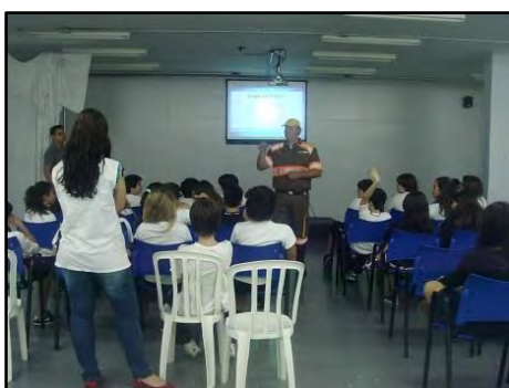
Agente de Trânsito na Escola

A atividade Bate Papo sobre o Trânsito, realizada por agentes de trânsito e educadores, consiste em uma apresentação lúdica interativa que oferece ao operador, como agente multiplicador, a oportunidade de executar a sua função de orientador e educador, junto à comunidade escolar. Público alvo: alunos do último ano do Ensino Fundamental I. Duração: 50 minutos.