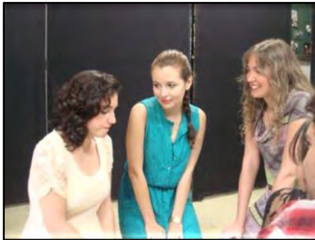
Teatro para Ensino Médio - Inconsequente Baby

Atividade realizada nas Escolas de Ensino Médio, que utiliza a linguagem do teatro para fazer os alunos refletirem sobre a importância da segurança no trânsito, os comportamentos adequados e éticos e mobilidade sustentável. Aborda assuntos tais como álcool e direção, habilitação, travessia, condução de motocicletas, entre outros.