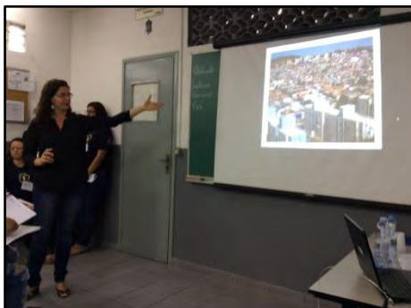
Palestra Mobilidade Urbana – Caminhos para reinventar a cidade

A palestra, realizada em empresas, traz uma reflexão sobre o esgotamento do modelo de mobilidade que privilegia o uso do carro particular, e um debate sobre os possíveis caminhos para a reinvenção da cidade, com uma mobilidade voltada para a qualidade de vida da coletividade.