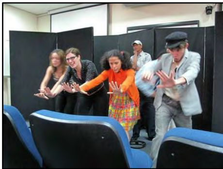
Teatro de Adulto – A Árvore do Trânsito

Atividade realizada em empresas, instituições ou locais públicos, cuja proposta é abordar a questão da solidariedade nas relações interpessoais no trânsito. Entretanto, as temáticas são ampliadas na diversidade das dinâmicas e motivações individuais de cada um de seus protagonistas, dos históricos pessoais ocorridos, anterior ao encontro dos mesmos num engarrafamento no trânsito. Duração: 30 minutos