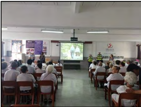
Workshop - Mobilidade Segura um Direito da Pessoa Idosa

Essa palestra, realizada em instituições, propõe uma reflexão sobre a mobilidade segura da pessoa idosa, aborda as limitações que surgem com o envelhecimento, as situações de risco na circulação e travessia, estatísticas e estudo de casos, os direitos da pessoa idosa entre outros. Com duração de aproximadamente, duas horas, educadores da CET e policiais da CPTRAN apresentam uma palestra dinâmica e interativa que termina com um bingo de Trânsito para a fixação dos conceitos abordados.