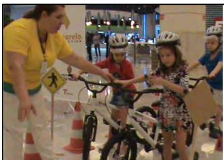
Mini circuito de Bike

Em um circuito em forma de U, limitado por cones e fitas amarelas e pretas, ligado por uma faixa de pedestres, as crianças após receberem instruções e colocarem os capacetes, montam nas bikes e pedalam até a faixa de segurança, onde devolvem as bikes e fazem a travessia a pé. O objetivo é apresentar noções básicas de segurança do ciclista, como uso de capacete, utilizar locais seguros para pedalar.