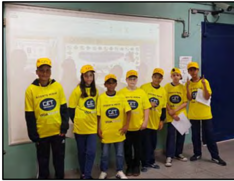
Programa Agente Mirim