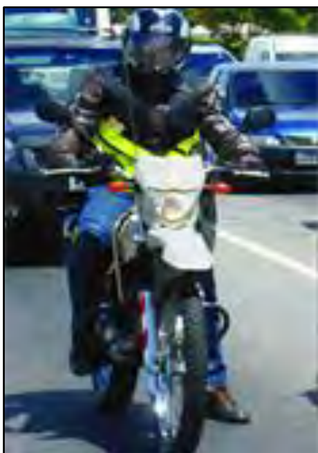
Curso para Profissionais de Motofrete e atualização

O Curso de atualização para Profissionais de Motofrete tem como objetivo relembrar e atualizar conhecimentos e técnicas de pilotagem. Tem duração de 10 horas/aula e é realizado em 2 dias úteis, das 8h30 às 13h30 com módulos teórico e prático.