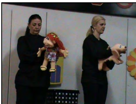
Teatro de Fantoches – A História de Bob

Atividade realizada nas escolas de educação infantil que utiliza o teatro como recurso pedagógico para transmitir conceitos básicos de segurança. Público alvo: crianças entre 03 e 06 anos de idade. Duração: 50 minutos.