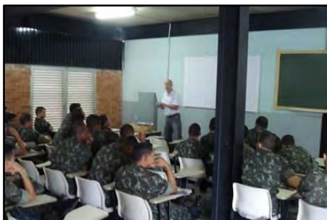
Palestra Pilotagem Segura

Palestra ministrada em empresas ou instituições para motociclistas e passageiros de motocicletas (garupas), com o objetivo de trabalhar os fatores que ampliam a segurança do motociclista, bem como promover a reflexão sobre a importância da prática da pilotagem segura. Carga horária: 1 hora.