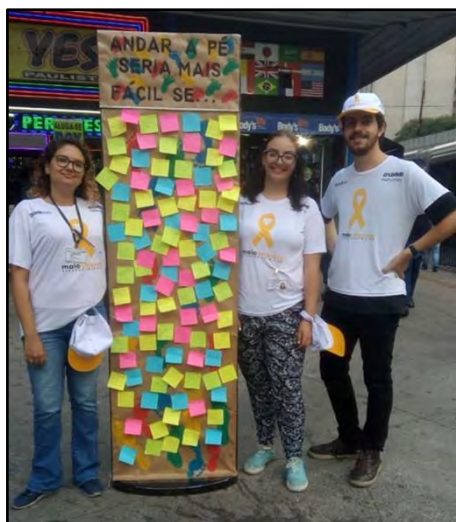
Painel de opinião e percepção