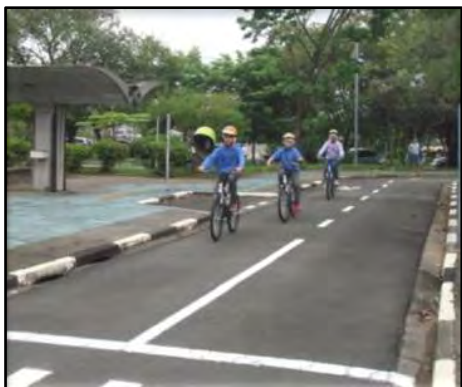
Desafios do Trânsito

A atividade Desafios do Trânsito é realizada no Espaço Vivencial de Trânsito Caio Graco. Durante a caminhada realizada ou pedalando em circuito sinalizado, os adolescentes buscam soluções para os desafios propostos tendo em vista as regras de segurança. Público alvo: alunos do Ensino Fundamental II. Duração: 2h30.