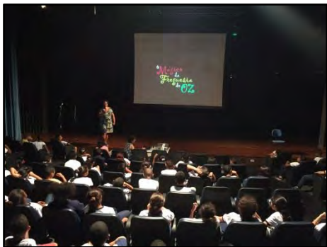
CineTrânsito – O Mágico da Freguesia de Oz

desafios e situações que a fazem ultrapassar obstáculos, enfrentar medos e fazer descobertas junto com seus amigos até chegar à Freguesia de Óz. Os conceitos de segurança do pedestre, cidadania e sustentabilidade são trabalhados no decorrer da história.