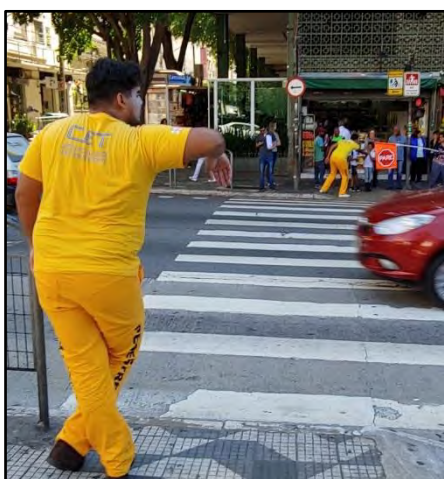
Travessia Segura – Mímicos

Atividade realizada por meio da atuação dos mímicos posicionados em cruzamentos críticos da Cidade com acentuado número de atropelamentos. De forma lúdica e bem-humorada, o objetivo é incentivar, através da interação com os mímicos, o respeito à sinalização de trânsito e às regras do Código de Trânsito Brasileiro, orientando os pedestres a atravessar em locais seguros e sinalizados, de acordo com os estágios dos semáforos destinados a eles, e estimulando os motoristas a obedecer às faixas de travessia. A ação dos mímicos é educativa com vistas a sensibilizar, pedestres e condutores, a adotarem atitudes seguras no trânsito evitando e prevenindo a ocorrência de acidentes.