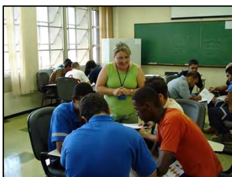
Curso Direção Defensiva e Primeiros Socorros

As técnicas de Direção Defensiva, quando utilizadas pelo motorista, ampliam a segurança dos ocupantes do veículo e dos demais usuários da via. Este é o objetivo deste curso que aborda também procedimentos de primeiros socorros que todo indivíduo deve conhecer para atuar em situações de emergência. Público alvo: empresas que buscam o aperfeiçoamento de seus empregados e também a motoristas que, individualmente, almejam seu aprimoramento. Carga horária: 16 horas divididas em dois dias consecutivos.