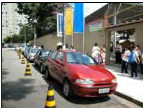
Travessia da comunidade escolar

Trabalho educativo de orientação de circulação e travessia da comunidade escolar, capacitando funcionários das escolas para auxiliarem na travessia e no embarque/desembarque de alunos nos horários de entrada e saída dos escolares, visando ampliar a segurança e minimizar os impactos no trânsito. Essa atividade é realizada em escolas públicas, particulares e empresas da Cidade de São Paulo.