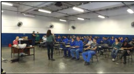
Palestra - Sustentabilidade e Mobilidade Urbana

Palestra, realizada em empresas que propõe uma reflexão sobre o impacto ocasionado pelo trânsito e transportes na construção da cidade de São Paulo, e quanto estes modelos refletem na sustentabilidade atual e futura de nosso ambiente urbano.