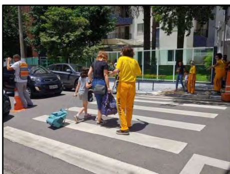
Mímica Volta às aulas

Técnica utilizada, exclusivamente, por meio da comunicação não verbal, transmitindo orientações a respeito de segurança no trânsito, dirigidas aos pedestres, ciclistas e condutores em geral, de forma lúdica e bem-humorada. Esse trabalho é realizado em vários pontos da cidade, preferencialmente, em cruzamentos críticos situados nas proximidades de escolas (Operação Volta às Aulas), estabelecimentos públicos, centros comerciais e em grandes vias/avenidas.