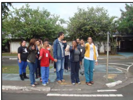
Programa de Educação de Trânsito para Pessoas com Deficiência

Essa atividade, realizada no Espaço Vivencial de Trânsito, tem por objetivo incluir a pessoa com deficiência nos diferentes segmentos sociais: trabalho, escola e circulação independente; reduzir o número de acidentes e atropelamentos envolvendo o público-alvo; desenvolver o senso de perigo no trânsito; realizar tarefas que estabeleçam padrões de segurança na mobilidade urbana.