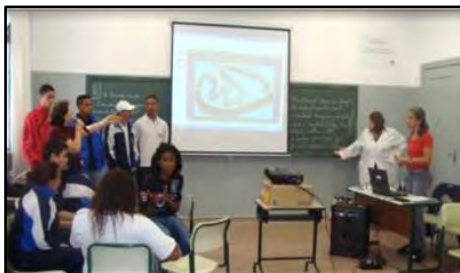
GP da Segurança

O Grande Prêmio da Segurança é um jogo interativo, de percurso, onde os peões percorrem os pontos estratégicos do circuito do autódromo de Interlagos, à medida que os grupos respondem as questões e desafios que estimulam a reflexão e a sensibilização a respeito da importância das regras para a segurança no trânsito e dos diferentes comportamentos adotados no espaço público e suas implicações. Público alvo: alunos do Ensino Médio. Duração: 2 horas