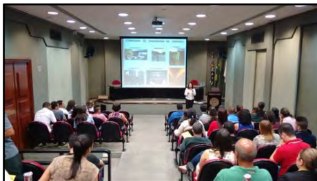
Palestra O Ciclista e Mobilidade Urbana

daqueles que já utilizam este veículo nos seus deslocamentos. com o objetivo de atualizar conhecimentos sobre mobilidade urbana, orientar o ciclista sobre o uso adequado e seguro da bicicleta e levar os participantes à reflexão sobre a importância da inclusão de modos alternativos de transporte para a promoção de um trânsito mais seguro e sustentável. Público alvo: população em geral. Carga horária: 1 hora.