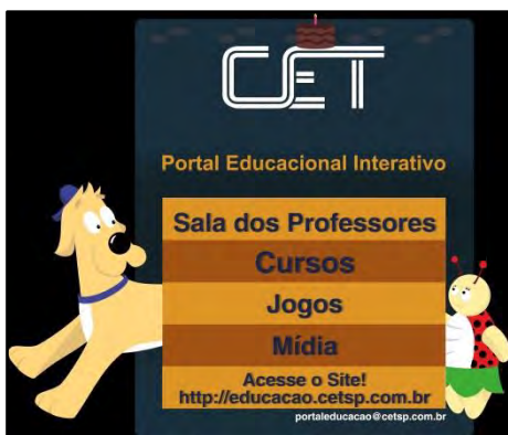
Portal Interativo Educacional