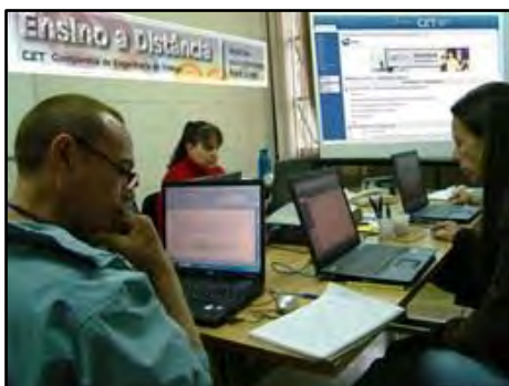
Cursos na Modalidade a Distância

desenvolvimento social do país, torna-se um ambiente propício para ampliar o trabalho de educação de trânsito e capacitar docentes para serem agentes multiplicadores nas escolas e na comunidade.