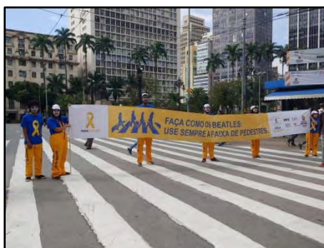
Mímica Maio Amarelo