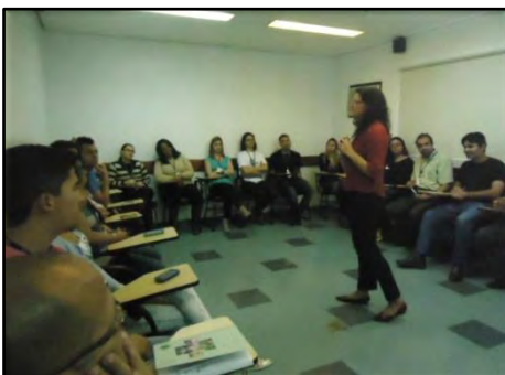
Palestra - Mobilidade Urbana e Cultura de Paz

A palestra, realizada em empresas, faz uma trajetória da realidade do trânsito hoje, caracterizado pela violência, intolerância e impaciência, para uma realidade pacífica, caracterizada pela cooperação e harmonia, e suscita reflexões sobre como nossas atitudes resultam em uma mobilidade mais pacífica e solidária. Dentro dessa trajetória é ressaltada a importância do papel de cada um de nós, através de nossas escolhas, crenças e atitudes.