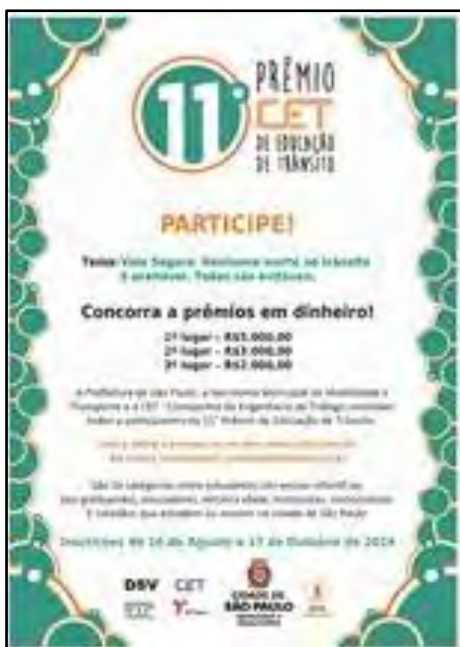
Prêmio CET de Educação de Trânsito

Concurso público anual que tem por objetivo incentivar a reflexão, a criatividade e a produção de trabalhos voltados para a segurança no trânsito. O Prêmio CET atinge a população do município de São Paulo, a partir dos 3 anos de idade, idosos, condutores em geral, incluindo ciclistas e motociclistas, entre outros. Assim, as categorias que compõem o prêmio procuram atingir todo cidadão usuário do sistema – trânsito, passageiro, pedestre, condutor e agente de trânsito. No Ano de 2019 – aconteceu a 11ª Edição - como tema central "Vida Segura: Nenhuma morte no trânsito é aceitável. Todas são evitáveis".