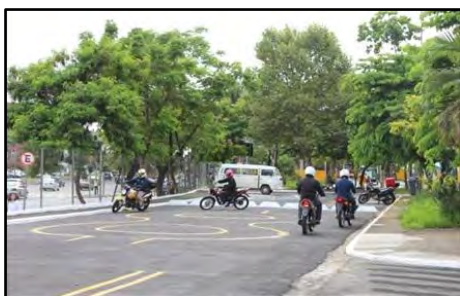
Curso Pilotagem Segura para Motociclistas

Desenvolver valores de segurança e cidadania e promover o aprimoramento de técnicas de pilotagem de motocicletas são os principais objetivos deste curso que compreende módulo teórico e prático. Na primeira etapa são abordados conceitos de legislação de trânsito, manutenção preventiva da moto, prevenção de acidentes, primeiros socorros e, principalmente, o comprometimento do motociclista com a sua segurança e dos demais usuários da via. O módulo prático é realizado em pista de treinamento com motocicletas da CET. Os exercícios propiciam a correção de vícios e posturas que interferem negativamente na pilotagem. Público alvo: Empresas que buscam o aperfeiçoamento de seus empregados usuários de motocicletas e também motociclistas que, individualmente, almejam seu aprimoramento. Carga horária: Módulo teórico: 8 horas divididas em dois períodos de quatro horas e Módulo prático: 8 horas.