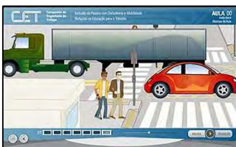
Inclusão da Pessoa com Deficiência e Mobilidade Reduzida na Educação para o Trânsito.

O curso tem como objetivo principal a conscientização da população no que diz respeito às pessoas com deficiência e o processo de inclusão delas na sociedade. Público alvo: Educadores; Profissionais de ONGs; Cuidadores; Interessados no tema. Carga horária: 20 horas. Temas: Contexto mundial e brasileiro das pessoas com deficiência e as características de cada deficiência; Aspectos legais relevantes sobre a pessoa com deficiência e a definição de Desenho Universal; Processos de inclusão e integração e o processo de inclusão da pessoa com deficiência no Ensino Infantil e Fundamental; A circulação urbana da pessoa com deficiência.