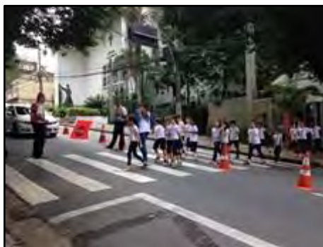
Embarque e desembarque de alunos