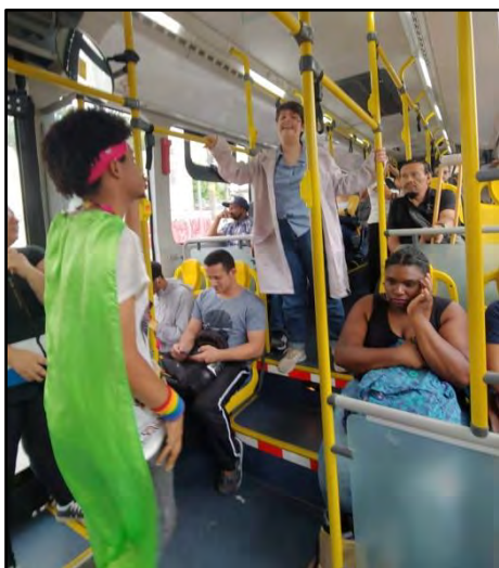
Esquete Teatral - Dr Stress e Super De Boa

O esquete interativo tem por objetivo promover a reflexão sobre a incidência de atropelamentos em corredores/faixas exclusivas de ônibus. A peça conta a história de um homem apressado e estressado que deseja reunir uma legião de estressados que tem atitudes erradas no trânsito e juntos, dominar o mundo. Surge a "Super De Boa" heroína que vem para salvar o mundo através da calma e da educação. A atividade é realizada em terminais de ônibus e no interior do transporte Coletivo, sendo dirigida aos seus usuários. Duração: 5 minutos.