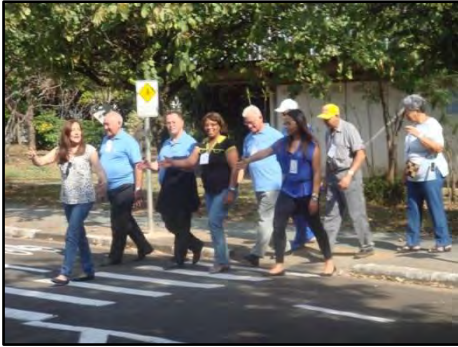
Programa de Educação de Trânsito para Terceira Idade