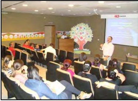
Palestra - Acessibilidade e Mobilidade Urbana