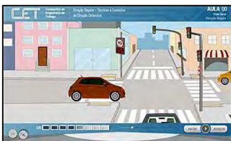
Direção Segura - Técnicas e Conceitos de Direção Defensiva

O curso tem como objetivo auxiliar na prevenção de acidentes, através do aprimoramento de técnicas de direção segura e de conhecimentos e conceitos sobre o trânsito. Público alvo: Condutores habilitados de veículos automotores. Carga horária: 8 horas. Temas: O papel de cada indivíduo no trânsito e o conceito de Direção Segura ou Preventiva; Trânsito e o meio ambiente; Conceitos de segurança para pedestres, motociclistas e condutores de veículos. Ênfase na proteção e prioridade ao pedestre; Como evitar acidentes, dispositivos de segurança e procedimentos em caso de acidentes de trânsito.