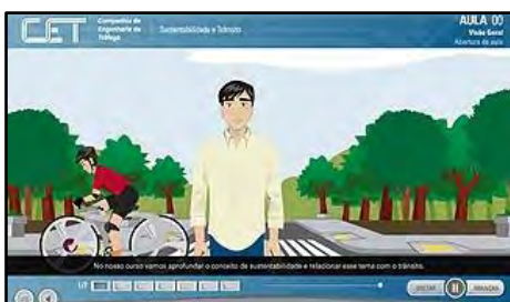
Sustentabilidade e Trânsito

O curso Sustentabilidade e Trânsito possibilita uma reflexão sobre o trânsito e o meio ambiente, e com a tomada de consciência dessa relação, a adoção de novos comportamentos e atitudes no cotidiano das grandes metrópoles. Público alvo: Professores da rede de ensino pública e privada; Estudantes de Licenciatura em pedagogia ou psicologia; Interessados pelo tema. Carga horária: 20 horas/aula cada. Temas: Mitologia Grega - Teoria de Gaia; Movimentos ambientalistas; Conceito de sustentabilidade; Panorama histórico; Conceito de cidadania, de espaço público e ética. Relação desses conceitos com a utilização responsável do espaço público.