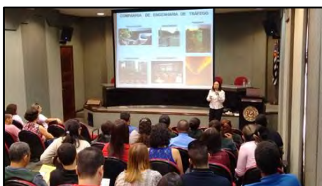
Palestra Mobilidade Urbana e Qualidade de Vida

Palestra realizada em Empresas com o objetivo de promover a reflexão sobre a necessidade de compartilhamento igualitário do espaço público entre todos os integrantes do sistema viário, bem como da necessidade de mudanças de atitude para uma melhor convivência no meio urbano. A palestra aborda também os impactos do trânsito na qualidade de vida da população. Público alvo: população em geral. Carga Horária: 1 hora