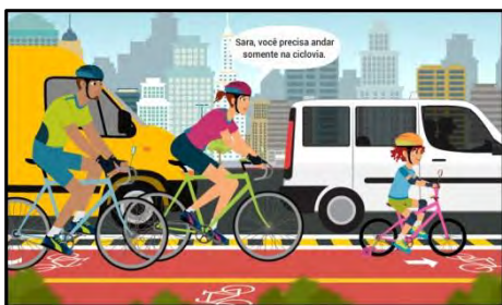
Pedalar com Segurança

serem cursadas no prazo de dez dias. Temas: A História da Bicicleta; O ciclista e o trânsito; Segurança durante o trajeto; Dicas de saúde.