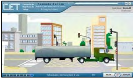
Ações Seguras no Trânsito