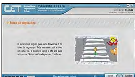
Segurança e Mobilidade

O Curso de Capacitação de Professores para o Ensino Fundamental I visa fornecer ao educador subsídios para que possa inserir o tema trânsito no currículo escolar. Público alvo: Professores da rede de ensino pública e privada; Estudantes de Licenciatura em pedagogia ou psicologia; Interessados pelo tema. Carga horária: 20 horas/aula cada. Temas: Reflexão sobre a importância de abordar o tema trânsito como exercício de cidadania e a importância da educação para o trânsito com este fim; Apresentação das características psicológicas e físicas da criança de 6 a 15 anos, considerando a interferência destes fatores na segurança no trânsito; Desenvolvimento de projetos que tenham como tema o trânsito, em toda a rede escolar de ensino da cidade de São Paulo.