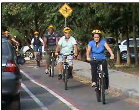
Curso Pedalar com Segurança

alongamento. Público alvo: maiores de 16 anos que saibam andar de bicicleta. Carga horária: Módulo teórico – 4 horas e Módulo Prático – 4 horas.