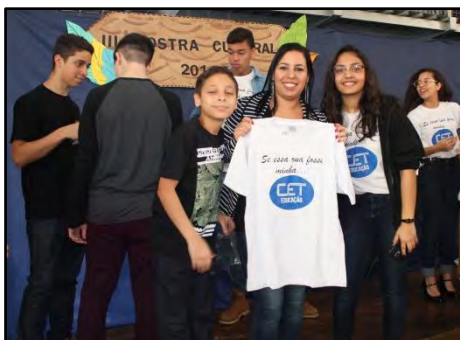
Projeto Geração Ativa