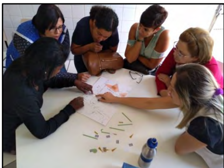
Rota Escolar Segura - Oficina Pedagógica

A partir do resultado de uma pesquisa realizada na região, a CET desenvolveu projetos de sinalização em um trecho crítico do bairro, para diminuir a velocidade dos veículos e colocar faixas de travessia. Com a finalidade de abrir a todos a participação e avaliação do projeto, foi realizada uma implantação da sinalização de forma temporária, por dois dias e posteriormente foi aplicada a sinalização definitiva. Ações da educação nas escolas da região: Caça ao tesouro, Agente de trânsito na escola, Desafios do Trânsito, Oficinas Pedagógicas para professores e coordenadores.