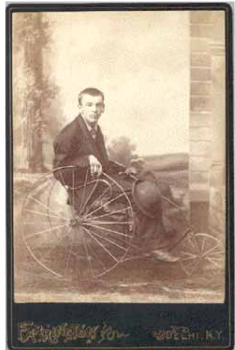
CADEIRA DE RODAS - SÉCULO XIX

Este período caracterizou-se pela provisão de abrigos e de assistência médico-social nas grandes instituições filantrópicas, segregadoras e isoladas da comunidade e com objetivos essencialmente caritativos. A pessoa abrigada era afastada da sociedade e recebia alimentação e cuidados dentro da instituição, em caráter permanente.