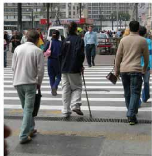
Rua Cel. Xavier de Toledo x Viaduto do Chá