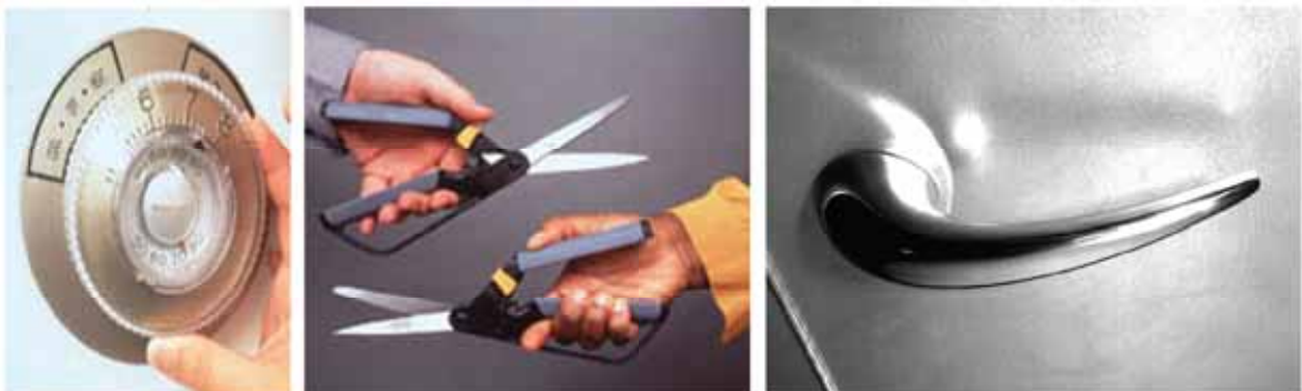
Objetos de uso equiparável (para pessoas com diferentes capacidades)

Este desconhecimento gera o que pode ser o maior dos impasses para a utilização do conceito do Desenho Universal , que é a falsa idéia de que haverá acréscimo no custo da obra, que na maioria dos casos não ultrapassa 2% do total."