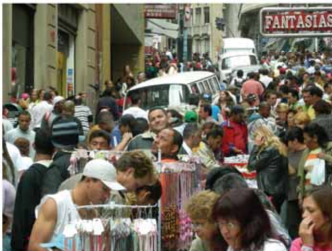
Ladeira Porto Geral São Paulo/SP

A partir destes estudos, pode-se perceber que, apesar da produção do espaço urbano continuar sendo feita, em grande parte, a partir dos referenciais do chamado “homem-padrão” (possuidor de todas as habilidades físicas, mentais e neurológicas), temos assistido, nas