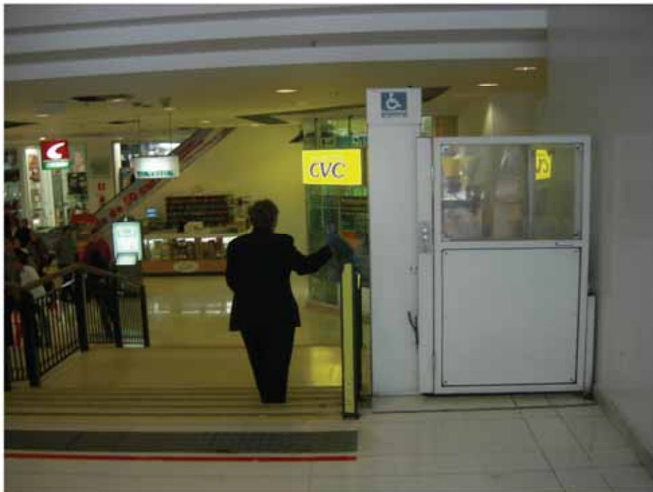
Shopping Center Santa Cruz - São Paulo/SP

Nesse sentido, Mobilidade Urbana é o conjunto de todas as possibilidades de deslocamento somado à utilização dos equipamentos urbanos. Como política pública / significa combinar, de forma eficiente e eficaz, ações integradas e integradoras que estabelecem regras e normas